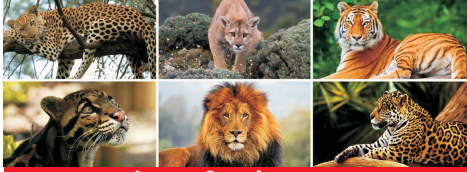
इंटरनेशनल बिग कैट्स एलायंस