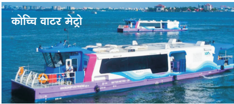
कोच्चि वाटर मेट्रो