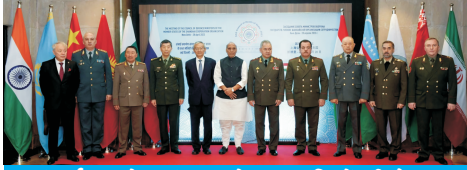
शंघाई सहयोग संगठन के रक्षा मंत्रियों की बैठक